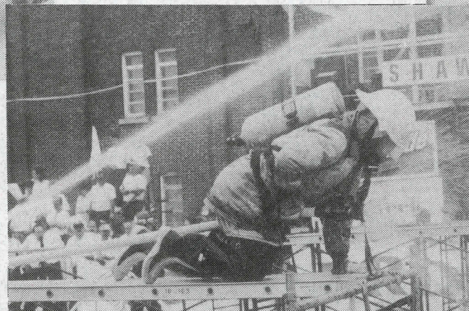
Pompier anonyme à la compétition provinciale des Pompiers tenue à Shawinigan cet été.