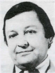
Le Centre communautaire

Le député du comté Jonquière, M. Gilles Marceau, nous annonçait durant la période des fêtes le versement d'une subvention de 225 000,00$ en vue de la création d'emplois dans la municipalité de Shipshaw. Cette subvention servira à la construction d'une centre communautaire et permettra de créer plusieurs emplois surtout dans le domaine de la construction.